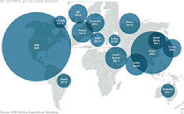
2018 ඉහල ම මිලිටරි පිරිවැය දැරූ 15 දෙනා

වත්මන් අරමුදල් නැඹුරුව දිගට ම පැවතුන හොත්, එක්සත් ජනපදය එලඹෙන දශකය පුරා අධ්‍යාපනය, යටිතල පහසුකම් හා නිදහස් සෞඛ්‍යය වැඩසටහන් මත දරන ඒකාබද්ධ පිරිවැයට සමාන ඩොලර් ට්‍රිලියන 7ක් වියදම් කරනු ඇතැයි කොංග්‍රස් අයවැය කාර්යාලය ප්‍රකාශනය කරයි.